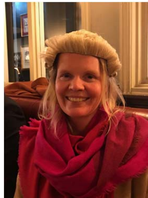
Vår ordförande som barrister