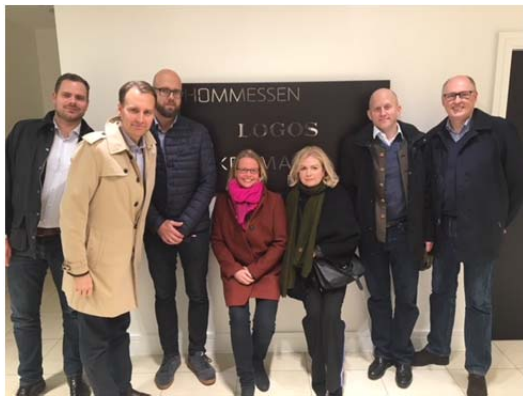
Styrelsen på LOGOS