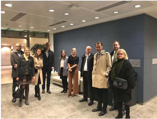
Sista minuterna på Slaughter and May

Avslutningsvis var det tvunget at pröva den legendariske peruken!